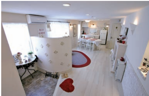
▲上品なアイボリーの空間に良い気を取り入れて

12月は人付き合いや縁を大切に ラッキーカラーは パステルグリーンやベージュです